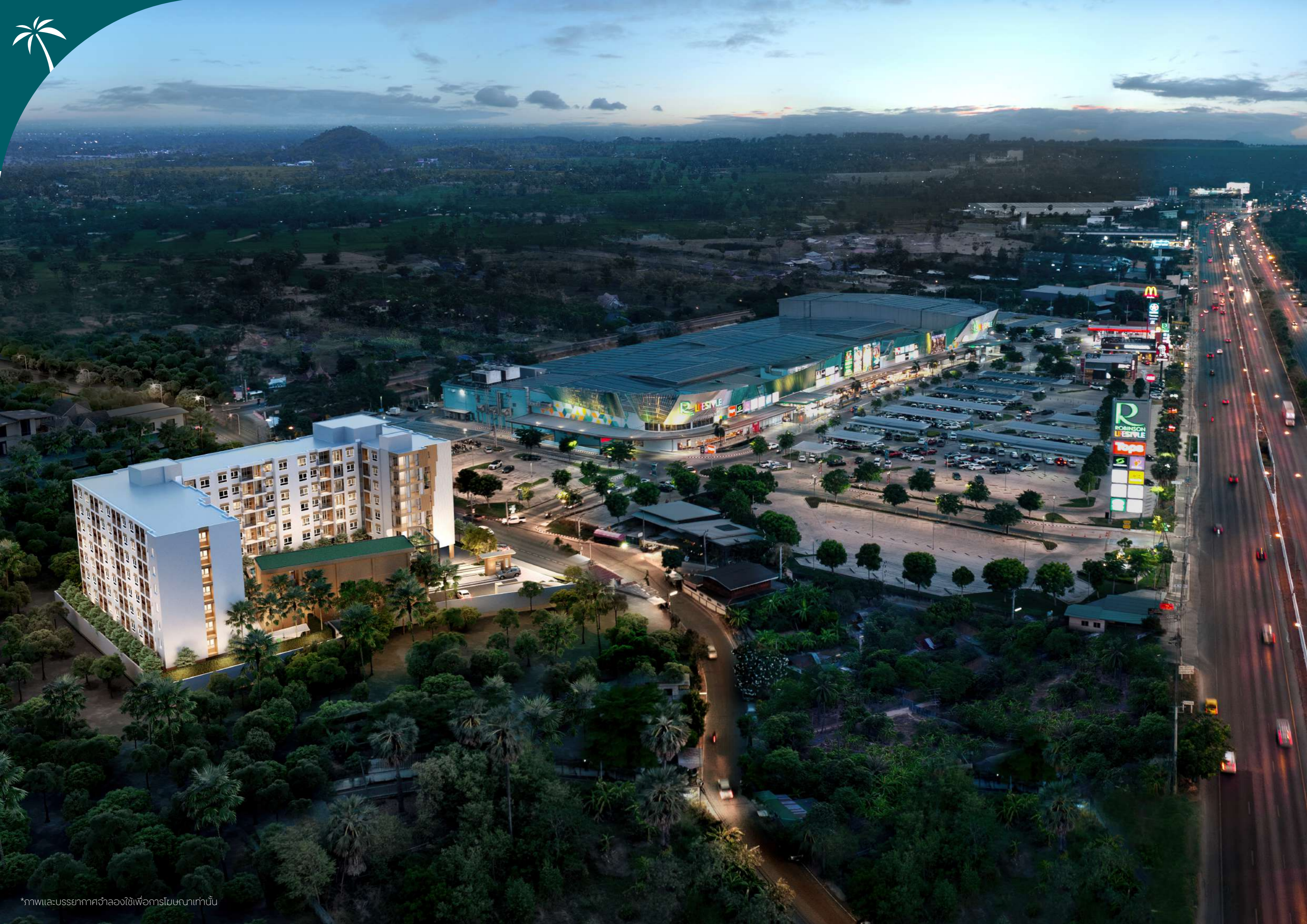
*ภาพและบรรยากาศจำลองใช้เพื่อการโฆษณาเท่านั้น